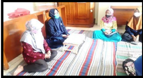
Gambar 2. Pemaparan materi