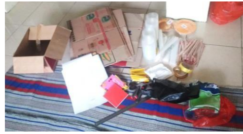
Gambar 3. Alat dan bahan yang digunakan

Pelatihan diawali dengan pengenalan alat dan bahan yang dapat disediakan di rumah dan digunakan untuk pembuatan APE serta contoh APE yang dibuat dari bahan bekas, seperti kardus.