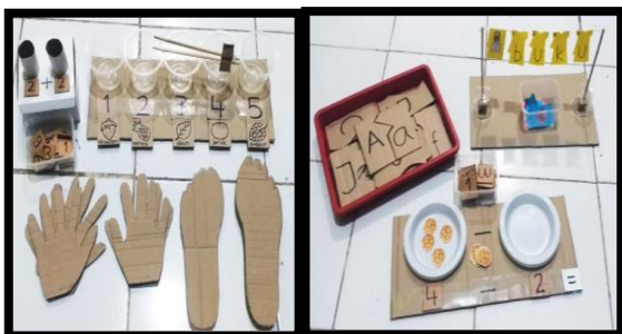
Gambar 6. APE hasil karya peserta

gambar cara berwudhu dengan cara mengurutkan urutan angkanya, APE mencocokkan potongan piring plastik yang ditulisi jumlah titik-titik dengan angkanya, APE memasukan guntingan sedotan ke dalam tiang sesuai angkanya dan digunakan untuk penjumlahan atau pengurangan, APE menyusun puzzle guntingan gambar berdasarkan urutan angkanya, APE menyusun huruf-huruf membentuk kata dengan menyesuaikan warna gambar dengan warna huruf, dan APE memancing huruf-huruf untuk membentuk kata.