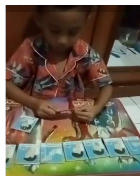
Gambar 8. Foto anak menggunakan APE buatan orangtua