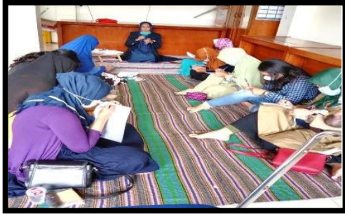
Gambar 1. Pengisian kuesioner