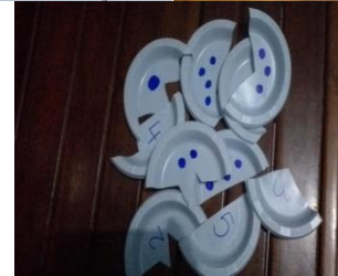
Gambar 4. Contoh APE

Kegiatan selanjutnya adalah memberi kesempatan kepada ibu-ibu peserta kegiatan untuk mencoba membuat APE berdasarkan kreasinya sendiri. APE yang belum dapat diselesaikan di lokasi kegiatan, dapat melanjutkan pembuatannya di rumah.