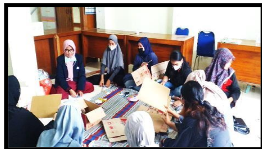
Gambar 5. Foto kegiatan orangtua membuat APE

Kegiatan selanjutnya adalah memberi kesempatan kepada ibu-ibu peserta kegiatan untuk mencoba membuat APE berdasarkan kreasinya sendiri. APE yang belum dapat diselesaikan di lokasi kegiatan, dapat melanjutkan pembuatannya di rumah.