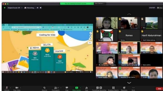
Gambar 4. Evaluasi dengan Kahoot

Evaluasi pemahaman peserta terhadap materi yang telah diberikan, dilakukan menggunakan kuis Kahoot, seperti terlihat pada Gambar 4. Kuis diberikan dua kali, sebelum memulai pelatihan dan setelah pelatihan. Pertanyaan yang diajukan adalah pertanyaan yang serupa dengan redaksi yang berbeda.