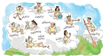
Gambar 1. Komputasi sebagai bagian integral dari sains

Revolusi Internet pada akhir abad 20, mengharuskan setiap siswa mempunyai kesempatan belajar tentang algoritma, bagaimana membuat program komputer, seperti halnya belajar fisika, kimia dan ilmu dasar lainnya. Hal ini sejalan dengan yang disampaikan oleh Peter J. Denning dalam tulisannya “ The Great Principles of Computing ” bahwa Komputasi mungkin merupakan domain besar keempat ilmu pengetahuan bersama dengan ilmu fisika, kehidupan, dan sosial (Peter J. Denning), seperti diilustrasikan pada Gambar 1.