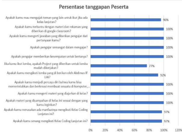
Gambar 6. Persentase tanggapan peserta secara keseluruhan

dengan menyebarkan form survey melalui Google form kepada peserta dan orang tua.