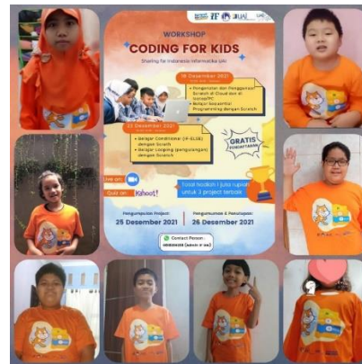
Gambar 2. Peserta Coding for Kids

Pelatihan Coding for Kids ini ditujukan untuk anak-anak dengan rentang usia 6-15 tahun atau di dari tingkat TK - SMP. Peserta kegiatan ini berjumlah 21 peserta yang terdiri dari 19 siswa SD (90%) dan 2 siswa SMP (10%) dan 12 siswa laki-laki (57%) dan 9 siswa perempuan (43%). Peserta antusias mengikuti pelatihan seperti terlihat pada Gambar 2.