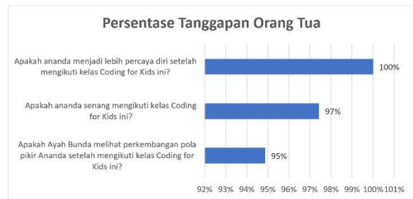
Gambar 7. Persentase tanggapan orang tua secara keseluruhan

Berdasarkan skoring yang telah dilakukan terhadap tanggapan orang tua, rata-rata persentase jawaban orang tua 95%, 97 % dan 100%, dengan rata-rata persentase sebesar 97%, seperti terlihat pada Gambar 7. Hal ini sesuai dengan respon dan tanggapan yang diberikan oleh peserta sebelumnya dan menunjukkan bahwa orang tua merasa puas dan memberikan tanggapan positif terhadap pelaksanaan kegiatan ini.