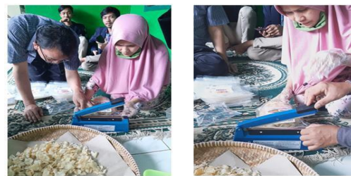
Gambar 8. Edukasi penggunaan mesin sealer plastik

Mesin sealer plastik pouch. Mesin sealer ini telah dimodifikasi agar suhunya bisa diatur. Tim pelaksana telah memberikan edukasi optimasi penggunaan mesin sealer terutama pada pengaturan lama waktu press mesin terhadap daya rekat plastik. Pada Gambar 8 diperlihatkan edukasi penggunaan mesin sealer plastik