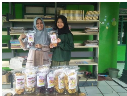
Gambar 10. Produk akhir UMKM

Sebelum dipasarkan produk keripik akan disimpan diruangan sejuk tanpa terkena matahari langsung. Untuk menghindari kerusakan, produk disimpan dalam keadaan tidak ditumpuk. Pada Gambar 10 diperlihatkan produk akhir keripik mitra UMKM.