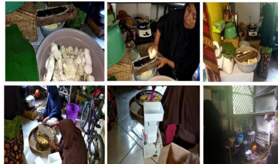
Gambar 2. Kegiatan pembuatan keripik di UMKM dilakukan secara konvensional.

Pada Gambar 2 diperlihatkan pembuatan keripik di UMKM di Desa Cikidang dilakukan secara konvensional.