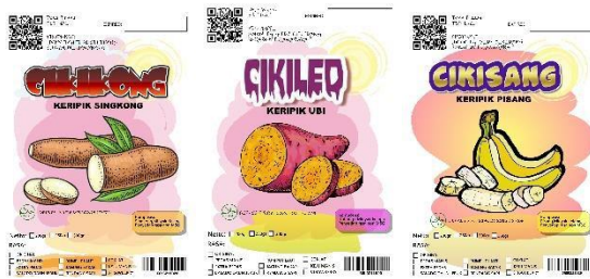
Gambar 9. Stiker kemasan Produk

Sebelum dipasarkan produk keripik akan disimpan diruangan sejuk tanpa terkena matahari langsung. Untuk menghindari kerusakan, produk disimpan dalam keadaan tidak ditumpuk. Pada Gambar 10 diperlihatkan produk akhir keripik mitra UMKM.