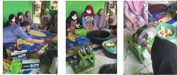
Gambar 7. Edukasi Penggunaan mesin tiris ( spinner ).

Mesin spinner (peniris) adalah mesin untuk menghilangkan residu minyak berlebih. Pada Gambar 7 diperlihatkan edukasi penggunaan mesin tiris ( spinner )