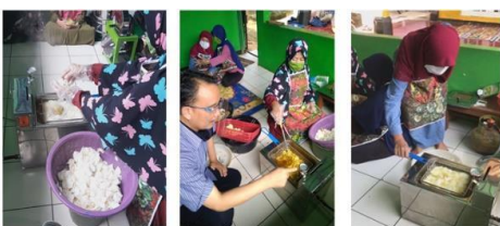
Gambar 6. Edukasi penanganan Ketel deep frying

Hasil akan optimal apabila perajangan bahan pisang, mesin slicer diputar pada kecepatan 200-300 rpm. Optimasi diukur dari hasil rajangan tidak rusak dan ketebalan sesuai keinginan. Ketel penggorengan telah dilengkapi dengan termometer mekanik dan timer. Pada Gambar 6 diperlihatkan edukasi penanganan ketel deep frying .