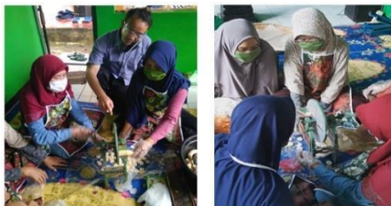
Gambar 5. Edukasi penanganan mesin rajang manual (perajang pisang).

Hasil akan optimal apabila perajangan bahan singkong dan ubi, mesin slicer diputar pada kecepatan 800-900 rpm ( rotate per menit ). Mesin rajang manual diputar secara manual menggunakan tuas putar. Mesin rajang manual cocok buat bahan kripiq yang lunak seperti pisang. Pada Gambar 5 diperlihatkan edukasi penanganan mesin rajang manual (perajang pisang).