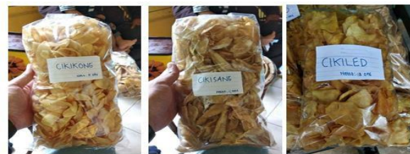
Gambar 3. Display produk keripik mitra UMKM Cikidang

Pada Gambar 3 diperlihatkan display produk keripik mitra UMKM Cikidang.