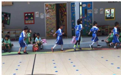
Gambar 5. Anak sedang berlari keliling lapangan

berinisial S sudah menguasai teknik-teknik dasar futsal terlihat saat latihan, walaupun teknik yang dikuasai oleh S lebih menguasai teknik passing kepada teman satu tim saat bertanding melawan tim anak laki-laki.