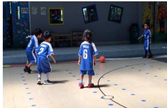
Gambar 4. Anak mentaati aturan

kognitif anak perempuan berkembang saat mengikuti ekstrakurikuler futsal terlihat saat anak menggunakan strategi untuk menggocek lawan dan saat mereka menggunakan teknik-teknik dasar futsal. Kemampuan sosial emosional anak juga terlihat ketika bermain futsal yaitu anak mentaati aturan-aturan yang telah diajarkan oleh coach dan anak perempuan juga dapat bersosialisasi dengan timnya yang didominasi oleh anak laki-laki.