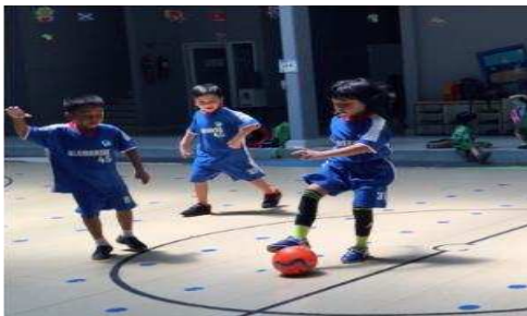
Gambar 3. Anak melakukan teknik control bola

Berdasarkan hasil wawancara, kegiatan ekstrakurikuler futsal TK Islam Al Azhar 45 merupakan ekstrakurikuler berkelanjutan dari anak kelompok A. Dikatakan berkelanjutan karena, tidak tersedianya waktu pergantian ekstrakurikuler jika anak atau orangtua menginginkan pindah ekstrakurikuler lain. Dalam kegiatan ekstrakurikuler futsal selalu ada kontribusi antara pelatih dengan guru, ketika saat latihan ataupun saat pertandingan.