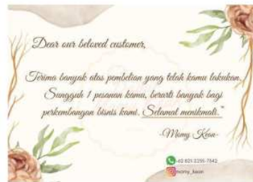
Gambar 3. Desain Thank You Card

Desain-desain tersebut dicetak dalam bentuk fisik untuk diletakkan di depan toko UMKM. Thank you card diberikan kepada para customer langsung saat memesan produk. Berikut merupakan bentuk fisik banner dan pemberian thank you card pada produk yang dijual.