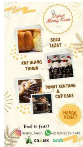
Gambar 2. Desain Banner

Penyajian promosi menggunakan banner berpengaruh bersama-sama terhadap perhatian, minat, dan keinginan (Silvana & Damayanty, 2014). Kegiatan ini merupakan kegiatan lanjutan dari diskusi terkait marketing strategy , yang mana salah satu media untuk mempromosikan produk adalah dengan membuat stand banner dan pemberian thank you card . Promosi melalui stand banner dan thank you card merupakan bentuk menjaga hubungan baik dengan para konsumen dan membuat konsumen lebih berminat dan tertarik terhadap produk yang dijual oleh UMKM. Gambar 2 di bawah ini merupakan desain banner yang dirancang oleh mahasiswa dan gambar 3 merupakan gambar dari desain thank you card .