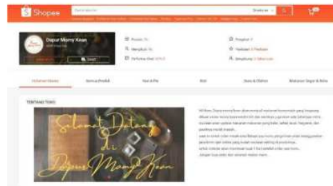
Gambar 6. Tampilan Toko di Shopee

Kegiatan ini merupakan kegiatan lanjutan dari kegiatan sebelumnya yaitu edukasi terkait digital marketing dan cara berjualan online di Shopee. Dilanjutkan dengan praktek langsung membuat akun di Shopee dan mempraktekan cara berjualan di Shopee yang sudah dipelajari pada kegiatan sebelumnya.