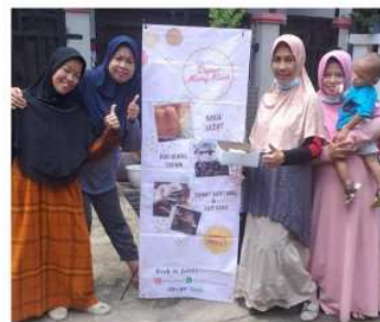
Gambar 4. Banner Fisik

Desain-desain tersebut dicetak dalam bentuk fisik untuk diletakkan di depan toko UMKM. Thank you card diberikan kepada para customer langsung saat memesan produk. Berikut merupakan bentuk fisik banner dan pemberian thank you card pada produk yang dijual.