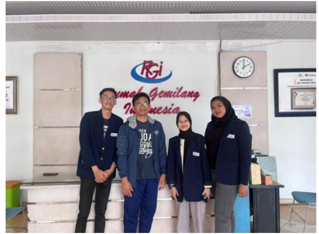
(Survei ke Rumah Gemilang pada tanggal 29 April 2023)