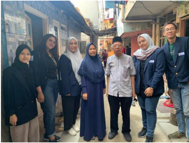
(Survey pertama pada tanggal 7 April 2023)