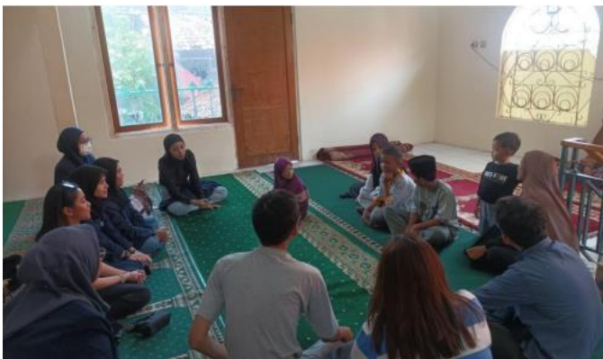
(Survei kedua pada tanggal 13 April 2023)