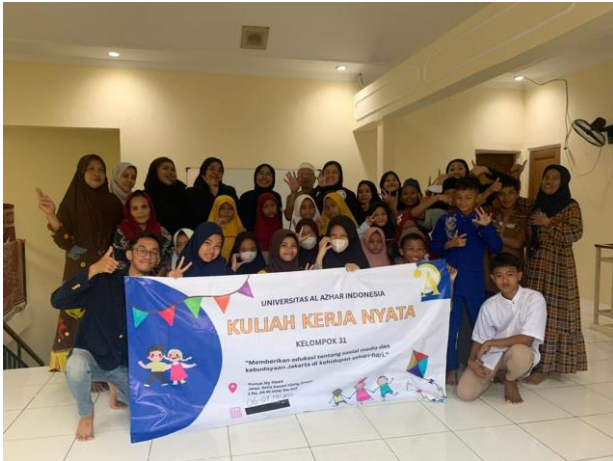
(Pelaksanaan KKN tanggal 6-7 Mei 2023)