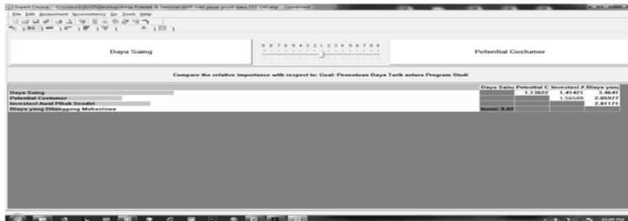
Gambar 2. Hasil Skala Penilaian Kombinasi Semua Pakar

Hasil kombinasi dari keseluruhan pakar, menghasilkan bobot dan skala tingkat kepentingan yang baru pada masing-masing kriteria dengan nilai incon atau Consistency Ratio sebesar 0.02. Bobot yang dihasilkan pada masing-masing kriteria antara lain 0.352 atau 35.2 % pada kriteria sustainability and development change , 0.238 atau 23.8% pada kriteria potential customer sebesar, 0.303 atau 30.3% pada kriteria investasi awal pihak sendiri, dan 0.107 atau 10.7% pada biaya yang ditanggung mahasiswa.