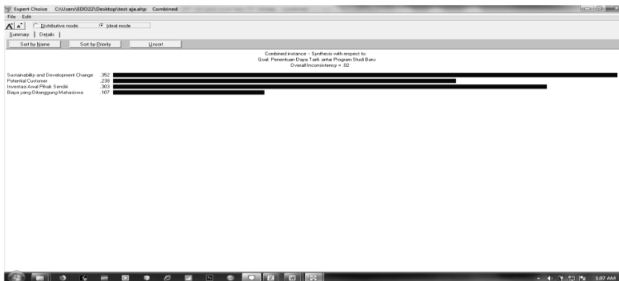
Gambar 4. Hasil Grafik dan Bobot Prioritas Kombinasi Penilaian Kriteria

Setelah mendapatkan hasil penilaian kombinasi seluruh pakar, untuk menampilkan hasil prioritas kriteria dalam bentuk grafik maka hal yang dilakukan adalah melakukan klik pada menu "Synthesize", lalu pilih submenu "With Respect to Goal". Sehingga grafik prioritas hasil kriteria akan ditampilkan seperti pada gambar 4.