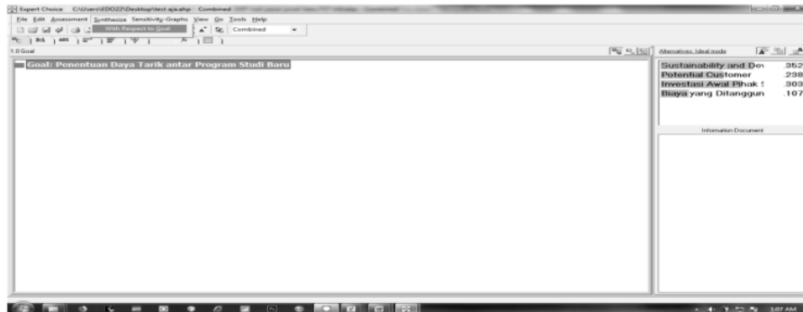
Gambar 3. Menu untuk Menampilkan Hasil Grafik

Setelah mendapatkan hasil penilaian kombinasi seluruh pakar, untuk menampilkan hasil prioritas kriteria dalam bentuk grafik maka hal yang dilakukan adalah melakukan klik pada menu "Synthesize", lalu pilih submenu "With Respect to Goal". Sehingga grafik prioritas hasil kriteria akan ditampilkan seperti pada gambar 4.