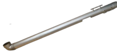
Gambar 3. Prototype dari produk LATIKMA

Setelah dilakukan semua perhitungan dan perancangan pada pengembangan produk LATIKMA setelah itu kita dapat merancang prototype dari produk LATIKMA . Berikut prototype dari produk LATIKMA :