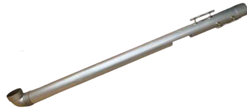
Gambar 3. Prototype dari produk LATIKMA

Setelah dilakukan semua perhitungan dan perancangan pada pengembangan produk LATIKMA setelah itu kita dapat merancang prototype dari produk LATIKMA . Berikut prototype dari produk LATIKMA :