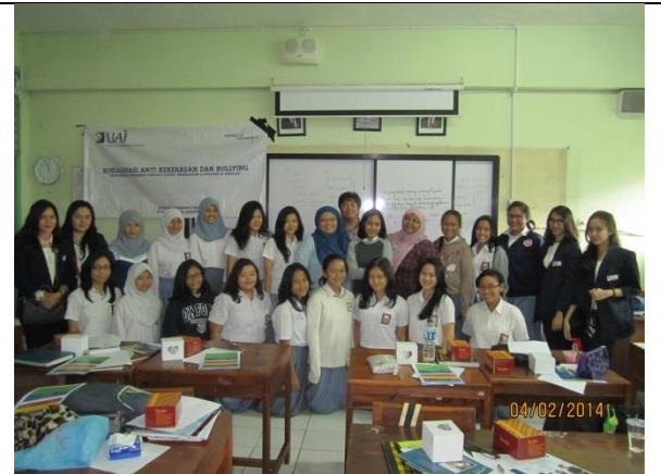
Bersama siswa perempuan kelas 11 IPS 1 SMAN 70