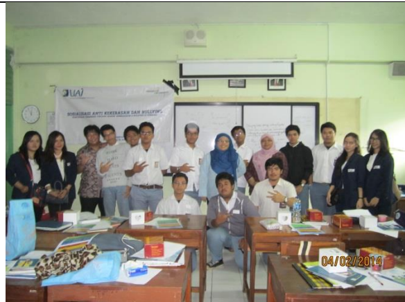
Bersama siswa pria Kelas 11 IPS 1 SMAN 70