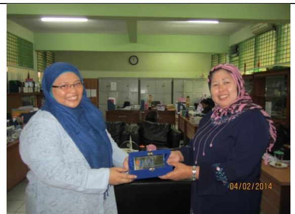
Penyerahan plakat UAI oleh Ketua Pelaksana pada perwakilan SMAN 70