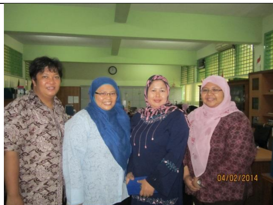
Para dosen UAI dan perwakilan guru SMAN 70