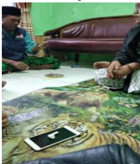
Gambar 3. Langkah-langkah yang dilakukan dalam melakukan Analisis

Berdasarkan wawancara yang dilakukan dengan perwakilan dari Komunitas Petani Saluyu, faktor-faktor yang menyebabkan warga tidak pernah menggunakan layanan Lembaga keuangan formal antara lain karena lokasi bank yang jauh dari pemukiman warga, Kekhawatiran dengan kompleksitas urusan administrasi, dan melihat kebiasaan tetangga dalam mengelola keuangan. Meskipun ada agen Branchless Banking di dekat Gelora Bandung Lautan Api (GBLA), masyarakat lebih memilih menyimpan kelebihan dana yang dimiliki pada Bendahara Madrasah atau mengikuti arisan.