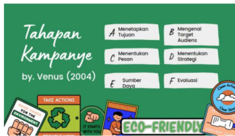
Gambar 4. Materi Penyuluhan Materi Penyuluhan Tahapan Kampanye ke-2