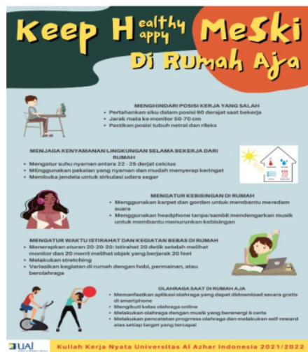
Gambar 8. Poster Penyuluhan Pola Hidup Bersih dan Sehat (PHBS)

Gambar 7 merupakan poster yang disebarakan terkait kiat-kiat pola hidup bersih dan sehat, sehingga warga dapat selalu saling mengingatkan untuk tetangga maupun keluarga untuk selalu menerapkan PHBS terutama di masa pandemic agar tidak mudah tertular virus Covid-19. Perancangan poster tersebut menggunakan bantuan ilustrasi gambar yang diambil dari Canva, sedangkan materi poster diambil berdasarkan artikel yang terdapat pada website PMI (Palang Merah Indonesia).