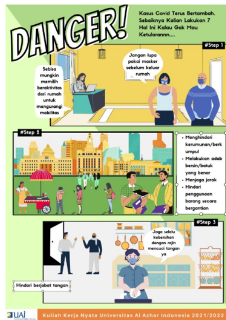
Gambar 9. Poster Penyuluhan Protokol Kesehatan

Gambar 8 merupakan poster yang disebarakan terkait kiat-kiat hidup ergonomis, sehingga terdapat warga yang mengalami keluhan akibat pola hidup yang ergonomis tidak lupa dengan bagaimana cara untuk mengatasi keluhannya dan selalu ingat dengan pentingnya hidup ergonomis sebagai penyeimbang aktivitas di kala pandemi sehingga menjaga tubuh tetap sehat dan jiwa bahagia. Perancangan poster tersebut menggunakan bantuan ilustrasi gambar yang diambil dari Canva, sedangkan materi poster diambil berdasarkan modul yang dirancang oleh Perhimpunan Ergonomi Indonesia (PEI) terkait panduan ergonomi saat WFH ( Work From Home ) dan LFH ( Learning From Home ).