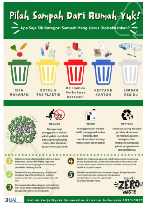
Gambar 6. Poster Penyuluhan Pengelolaan Sampah Mandiri

Gambar 3 dan 4 menunjukkan materi sosialisasi yang diberikan kepada TP PKK RW 003 setempat pada sesi 2. Materi ini juga bersumber dari Modul Training of Trainer “Edukator Pengelolaan Sampah” yang diberikan dari salah satu pengurus Bank Sampah di lingkungan RW. 002 Cipinang Besar Selatan saat melakukan studi banding di wilayah tersebut. Kemudian, setelah materi ini selesai, seperti yang digambarkan pada gambar 5.5 peserta juga diajak untuk membuat kerajinan sederhana dari kaos bekas yang dibuat menjadi tas tote bag atau tas belanja yang dapat dipakai berulang kali.