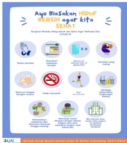
Gambar 7. Poster Penyuluhan Pola Hidup Bersih dan Sehat (PHBS)

Gambar 7 merupakan poster yang disebarakan terkait kiat-kiat pola hidup bersih dan sehat, sehingga warga dapat selalu saling mengingatkan untuk tetangga maupun keluarga untuk selalu menerapkan PHBS terutama di masa pandemic agar tidak mudah tertular virus Covid-19. Perancangan poster tersebut menggunakan bantuan ilustrasi gambar yang diambil dari Canva, sedangkan materi poster diambil berdasarkan artikel yang terdapat pada website PMI (Palang Merah Indonesia).