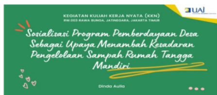
Gambar 1. Materi Penyuluhan Sosialisasi Program Pemberdayaan Desa ke-1

Berikut merupakan beberapa materi penyuluhan yang disampaikan kepada warga RT 009/RW 009 selama kegiatan pelaksanaan KKN.