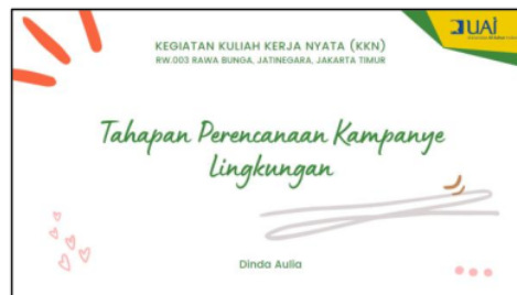
Gambar 3. Materi Penyuluhan Tahapan Kampanye ke-1

Kegiatan pertama yang dilakukan adalah sosialisasi dengan tema “Program Pemberdayaan Desa Sebagai Upaya Menambah Kesadaran Pengelolaan Sampah Rumah Tangga 7 mandiri”. Sosialisasi ini dilakukan selama 4 jam yang dibagi menjadi 2 sesi, yaitu sesi pertama berfokus pada sosialisasi program pemberdayaan desa dan sesi kedua berfokus kepada cara mengkampanyekan program desa kepada warga. Gambar 1 dan 2 menunjukkan materi sosialisasi yang diberikan kepada TP PKK RW 003 setempat pada sesi 1. Materi ini diambil berdasarkan studi literatur yang dikembangkan sesuai dengan permasalahan dan tujuan kegiatan KKN. Sumber utama yang digunakan sebagai bahan materi yaitu Modul Training of Trainer “Edukatör Pengelolaan Sampah” yang diberikan dari salah satu pengurus Bank Sampah di lingkungan RW. 002 Cipinang Besar Selatan saat melakukan studi banding di wilayah tersebut pada bulan Desember 2021. Modul ini mereka dap[12]an dari mitra mereka, yaitu Bank Sampah JGC yang didampingi oleh proyek PHINLA, sebuah program pengelolaan sampah global yang dilakukan di 3 negara, yaitu Philipina, Indonesia, dan Sri Lanka.