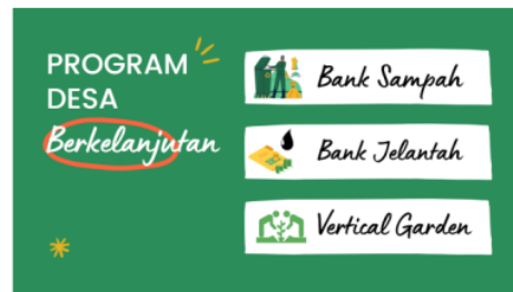
Gambar 2. Materi Penyuluhan Sosialisasi Program Pemberdayaan Desa (2)

Kegiatan pertama yang dilakukan adalah sosialisasi dengan tema “Program Pemberdayaan Desa Sebagai Upaya Menambah Kesadaran Pengelolaan Sampah Rumah Tangga 7 mandiri”. Sosialisasi ini dilakukan selama 4 jam yang dibagi menjadi 2 sesi, yaitu sesi pertama berfokus pada sosialisasi program pemberdayaan desa dan sesi kedua berfokus kepada cara mengkampanyekan program desa kepada warga. Gambar 1 dan 2 menunjukkan materi sosialisasi yang diberikan kepada TP PKK RW 003 setempat pada sesi 1. Materi ini diambil berdasarkan studi literatur yang dikembangkan sesuai dengan permasalahan dan tujuan kegiatan KKN. Sumber utama yang digunakan sebagai bahan materi yaitu Modul Training of Trainer “Edukatör Pengelolaan Sampah” yang diberikan dari salah satu pengurus Bank Sampah di lingkungan RW. 002 Cipinang Besar Selatan saat melakukan studi banding di wilayah tersebut pada bulan Desember 2021. Modul ini mereka dap[12]an dari mitra mereka, yaitu Bank Sampah JGC yang didampingi oleh proyek PHINLA, sebuah program pengelolaan sampah global yang dilakukan di 3 negara, yaitu Philipina, Indonesia, dan Sri Lanka.