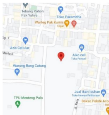
Gambar 1. Letak Bilik Pintar Indonesia

Kegiatan meningkatkan Pendidikan dan penghayatan agama Islam menuju Indonesia endemic yang dilaksanakan bertempat di Bilik Pintar Indonesia. Letak bilik pintar ini berada di Kawasan Menteng Atas, RT.8/RW.13, Kecamatan Setiabudi, Kota Jakarta Selatan, Daerah Khusus Ibukota dengan kelurahan yang memiliki kode pos 12960.