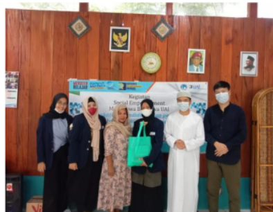
Gambar 8. Pemberian Manfaat oleh Mahasiswa Beasiswa UAI

Gambar 7 merupakan dokumentasi dari kegiatan pemutaran video kisah Nabi Yunus AS dan Asmaul Husna. Hasil kegiatan ini ditandai dengan perwakilan anak-anak Bilik Pintar yang dapat mengisahkan kembali secara singkat tentang Nabi Yunus dan melafalkan kembali beberapa Asmaul Husna setelah menonton video pemaparan terkait kisah Nabi Yunus AS dan Asmaul Husna. Anak-anak antusias dalam pembelajaran dengan metode audio-visual hal ini ditandai dengan hasil kuisioner yang mereka isi setelah kegiatan pengabdian masyarakat selesai. Selain disukai oleh anak-anak, metode ini juga dapat memudahkan anak-anak untuk memahami isi atau makna video tersebut. Setelah melaksanakan berbagai rangkaian kegiatan, perwakilan Mahasiswa penerima Beasiswa UAI memberikan barang-barang yang bermanfaat dan dapat digunakan di Bilik Pintar. Diharapkan bantuan kecil ini dapat berguna di Bilik Pintar. Pemberian ini juga bermaksud untuk berterima kasih kepada pengelola Bilik Pintar karena telah meluangkan dan memfasilitasi kegiatan ini