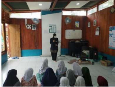
Gambar 4. Pembelajaran Bahasa Arab

Kegiatan pertama yang dilakukan adalah pengajaran ilmu Bahasa Arab dengan melafalkan beberapa kalimat pembuka dan kalimat perkenalan dalam Bahasa Arab. Dari hasil yang telah diajarkan Umi kepada anak-anak Bilik Pintar dapat dianalisis bahwa mereka tidak terbiasa berbicara menggunakan bahasa Arab karena belum mengenal kosakata yang ada di Bahasa Arab. Mereka menganggap Bahasa Arab sebagai bahasa asing yang membutuhkan kosakata-kosakata tertentu untuk dapat menerapkannya. Faktor timbulnya kesulitan dalam pembelajaran bahasa Arab disebabkan beberapa faktor diantaranya faktor linguistik dan faktor non linguistik. Faktor Linguistik yang menandakan bahwa kesulitan itu timbul dari dalam bahasa itu sendiri yang artinya antara bahasa Arab dengan bahasa Indonesia perbedaannya sangat besar sekali baik mengenai kosa kata, tata kalimat, dan bunyi maupun tulisan. Sedangkan Faktor Non Linguistik menandakan bahwa kesulitan itu timbul dari luar bahasa itu sendiri, termasuk bahasa adalah mempengaruhi terhadap pembiasaan pengajaran bahasa Arab (Syardiansah, 2019). Hasil kegiatan ini ditunjukkan dengan peningkatan kemampuan anak-anak dalam Bahasa Arab yang ditandai dengan kemampuan mereka dalam memperkenalkan diri menggunakan Bahasa Arab di akhir kegiatan. Oleh karena itu, kegiatan ini merupakan langkah awal yang bagus untuk mengenalkan Bahasa Arab kepada anak-anak Bilik Pintar (Amaliah & Prasetyo, 2021; Kadir et al., 2022; Visiaty & Piantari, 2019).