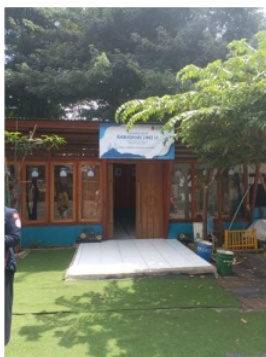
Gambar 2. Bilik Pintar Indonesia

Bilik pintar ini merupakan sebuah tempat yang sangat menginspirasi karena meskipun mayoritas masyarakatnya adalah pemulung, mereka memiliki semangat belajar (Syardiansah, 2019). Hal ini dikarenakan adanya kesadaran akan pentingnya pendidikan di kehidupan manusia khususnya anak-anak (Ariyanti, 2016). Namun, bilik pintar ini memiliki keterbatasan fasilitas pendidikan, salah satu keterbatasannya adalah kurangnya relawan pengajar khususnya yang berkaitan dengan ilmu agama Islam (Emani et al., 2014). Adapun keterbatasan Al-Qur'an, Juz Ama, dan buku Iqra yang tersedia tidak sampai 10 buah.