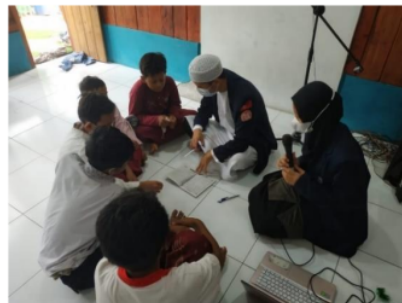
Gambar 6. Pengajaran Membaca Iqra (2)