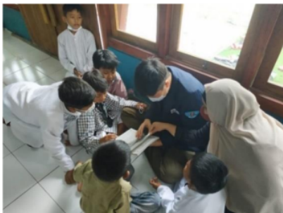
Gambar 5. Pengajaran Membaca Iqra (1)