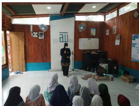
Gambar 4. Pembelajaran Bahasa Arab

Kegiatan pertama yang dilakukan adalah pengajaran ilmu Bahasa Arab dengan melafalkan beberapa kalimat pembuka dan kalimat perkenalan dalam Bahasa Arab. Dari hasil yang telah diajarkan Umi kepada anak-anak Bilik Pintar dapat dianalisis bahwa mereka tidak terbiasa berbicara menggunakan bahasa Arab karena belum mengenal kosakata yang ada di Bahasa Arab. Mereka menganggap Bahasa Arab sebagai bahasa asing yang membutuhkan kosakata-kosakata tertentu untuk dapat menerapkannya. Faktor timbulnya kesulitan dalam pembelajaran bahasa Arab disebabkan beberapa faktor diantaranya faktor linguistik dan faktor non linguistik. Faktor Linguistik yang menandakan bahwa kesulitan itu timbul dari dalam bahasa itu sendiri yang artinya antara bahasa Arab dengan bahasa Indonesia perbedaannya sangat besar sekali baik mengenai kosa kata, tata kalimat, tata bunyi maupun tulisan. Sedangkan Faktor Non Linguistik menandakan bahwa kesulitan itu timbul dari luar bahasa itu sendiri, termasuk bahasa adalah mempengaruhi terhadap pembiasaan pengajaran bahasa Arab (Syardiansah, 2019). Hasil kegiatan ini ditunjukkan dengan peningkatan kemampuan anak-anak dalam Bahasa Arab yang ditandai dengan kemampuan mereka dalam memperkenalkan diri menggunakan Baha Arab di akhir kegiatan. Oleh karena itu, kegiatan ini merupakan langkah awal yang bagus untuk mengenalkan Bahasa Arab kepada anak-anak Bilik Pintar (Amaliah & Prasetyo, 2021; Kadir et al., 2022; Visiaty & Piantari, 2019).