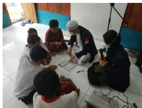
Gambar 6. Pengajaran Membaca Iqra (2)