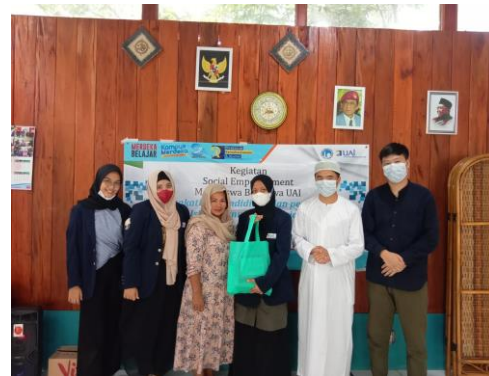
Gambar 8. Pemberian Manfaat oleh Mahasiswa Beasiswa UAI

Gambar 7 merupakan dokumentasi dari kegiatan pemutaran video kisah Nabi Yunus AS dan Asmaul Husna. Hasil kegiatan ini ditandai dengan perwakilan anak-anak Bilik Pintar yang dapat mengisahkan kembali secara singkat tentang Nabi Yunus dan melafalkan kembali beberapa Asmaul Husna setelah menonton video pemaparan terkait kisah Nabi Yunus AS dan Asmaul Husna. Anak-anak antusias dalam pembelajaran dengan metode audio-visual hal ini ditandai dengan hasil kuisioner yang mereka isi setelah kegiatan pengabdian msasyarakat selesai. Selain disukai oleh anak-anak, metode ini juga dapat memudahkan anak-anak untuk memahami isi atau makna video tersebut. Setelah melaksanakan berbagai rangkaian kegiatan, perwakilan Mahasiswa penerima Beasiswa UAI memberikan barang-barang yang bermanfaat dan dapat digunakan di Bilik Pintar. Diharapkan bantuan kecil ini dapat berguna di Bilik Pintar. Pemberian ini juga bermaksud untuk berterima kasih kepada pengelola Bilik Pintar karena telah meluangkan dan memfasilitasi kegiatan ini