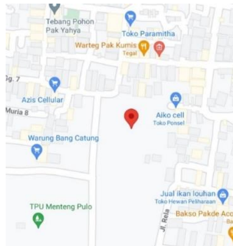
Gambar 1. Letak Bilik Pintar Indonesia

Kegiatan meningkatkan Pendidikan dan penghayatan agama Islam menuju Indonesia endemic yang dilaksanakan bertempat di Bilik Pintar Indonesia. Letak bilik pintar ini berada di Kawasan Menteng Atas, RT.8/RW.13, Kecamatan Setiabudi, Kota Jakarta Selatan, Daerah Khusus Ibukota dengan kelurahan yang memiliki kode pos 12960.