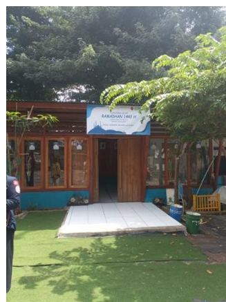
Gambar 2. Bilik Pintar Indonesia

Bilik pintar ini merupakan sebuah tempat yang sangat menginspirasi karena meskipun mayoritas masyarakatnya adalah pemulung, mereka memiliki semangat belajar (Syardiansah, 2019). Hal ini dikarenakan adanya kesadaran akan pentingnya pendidikan di kehidupan manusia khususnya anak-anak (Ariyanti, 2016). Namun, bilik pintar ini memiliki keterbatasan fasilitas pendidikan, salah satu keterbatasannya adalah kurangnya relawan pengajar khususnya yang berkaitan dengan ilmu agama Islam (Emani et al., 2014). Adapun keterbatasan Al-Qur'an, Juz Ama, dan buku Iqra yang tersedia tidak sampai 10 buah.