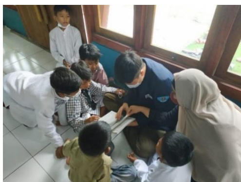
Gambar 5. Pengajaran Membaca Iqra (1)