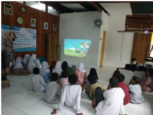
Gambar 7. Pemutaran Video Kisah Nabi Yunus AS dan Asmaul Husna