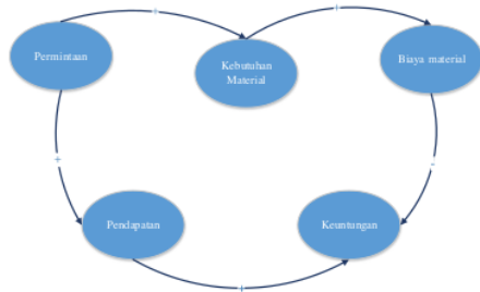
Gambar 2. CLD Prediksi Kebutuhan Material

Prediksi kebutuhan material akan dilakukan dengan membuat model mental sistem dinamik melalui Causal Loop Diagram (CLD), seperti disajikan pada Gambar 2.