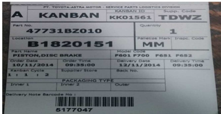
Gambar 3 Kanban

Step 1: Cek kanban untuk mengetahui material apa yang dibutuhkan jumlahnya berapa yang diperlukan pada waktu yang diperlukan. Berikut ini contoh gambar kanban: