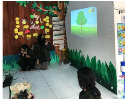
Gambar 3. Pemberian Materi Pembelajaran

Peserta pengabdian masyarakat dapat mencerna materi dengan mudah. Ini dibuktikan dengan adanya beberapa quiz seputar materi yang diajukan ke peserta dan peserta pun dapat menjawab pertanyaan-pertanyaan tersebut dengan benar serta terlihat sangat antusias.