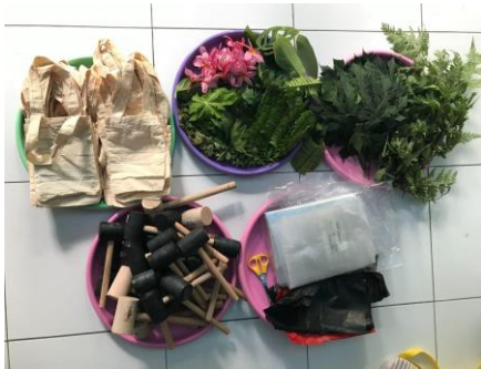
Gambar 2. Alat dan Bahan Eco-Printing

plastik hitam ukuran 15x20cm 40pcs, daun pepaya dan tanaman paku-pakuan, serta bunga kamboja.