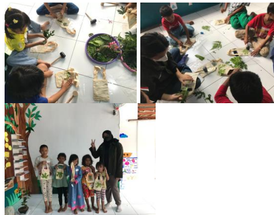
Gambar 4. Pelaksanaan dan hasil karya Eco-Printing

Proses eco-printing berjalan dengan lancar. Peserta terlihat sangat antusias dan gembira selama pembuatan eco-printing karena mereka dapat dengan bebas memilih jenis daun dan bunga yang ingin digunakan.