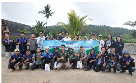
Gambar 4. Foto Bersama Usai Pelatihan Budidaya Maggot Dengan Jajaran Karang Taruna & Tim Abdimas UAI, 8 September 2022