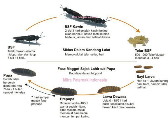
Gambar 2. Siklus Hidup Larva Maggot BSF Sebagai Pengurai Sampah Organik