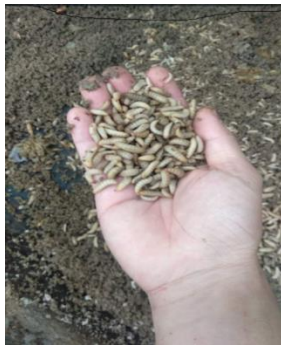
Gambar 7. Hasil Pendampingan : Maggot BSF Tumbuh Sehat & Gemuk

Saat Pendampingan: Periksa Kandang BSF dan BSF Hinggap di Daun Kering Dalam Kandang