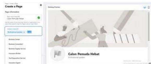
Gambar 7. Create Halaman Fb

Pada hari kedua yaitu Sabtu, 8 Januari 2022 penulis datang ke Panti Asuhan Al Jamiyatul Washliyah dengan membawa peralatan infokus dan tripod karena pada materi ini yaitu praktik cara beriklan di media sosial. Sebelum memulai kegiatan, penulis membaca doa belajar terlebih dahulu yang diiringi oleh adik adik. Selanjutnya, penulis sedikit mengulang materi sebelumnya untuk mengingat kembali apa yang telah dipelajari. Kemudian lanjut pada topik pembahasan utama yaitu pelatihan cara beriklan di media sosial dengan by step hingga selesai. Ketika membuat suatu iklan di facebook, setiap individu harus memiliki halaman facebook. Halaman facebook ini nanti akan dipakai untuk beriklan dan mengundang orang lain untuk join ke halaman facebook kita. Setelah itu tentukan segmen target market. Hal ini sangat penting karena semakin spesifik maka hasilnya akan semakin bagus.