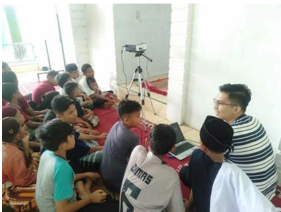
Gambar 10. Kegiatan hari kedua di Panti Asuhan tentang pelatihan cara beriklan di facebook dan instagram