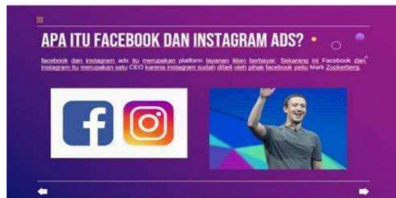
Gambar 2. Materi pada Hari Pertama tentang apa itu Facebook dan Instagram ads