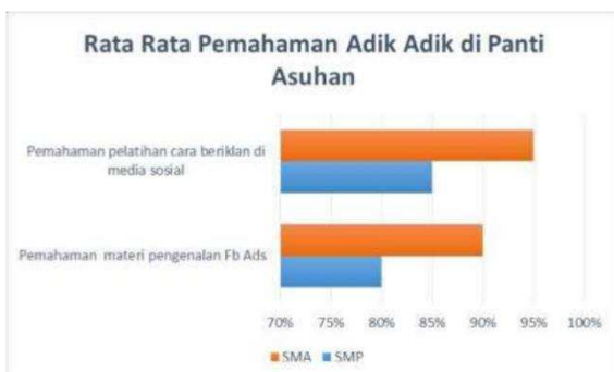
Gambar 11. Rata rata Pemahaman Adik Adik di Panti Asuhan Al Jamiyatul Washliyah pada materi 1 dan materi 2 pada usia SMP dan SMA

Setelah selesai memberikan pelatihan, penulis memberikan sebuah kuisisioner kepada adik adik untuk melihat seberapa jauh mereka dapat memahaminya. Hasilnya sebagai berikut: