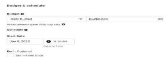
Gambar 8. Budget dan Schedule