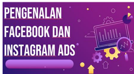
Gambar 1. Materi pada Hari Pertama tentang pengenalan Facebook dan Instagram Ads

Dalam pemaparan materi pengenalan facebook dan instagram ads . Materi yang penulis sampaikan ini sepenuhnya dibuat berdasarkan apa yang telah penulis pelajari dari webinar dan training serta hasil pengalaman penulis dalam beriklan.