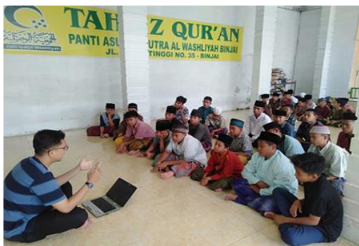
Gambar 6. Kegiatan hari pertama di panti asuhan yang sedang memaparkan materi pengenalan facebook dan Instagram Ads

Selama pembelajaran di hari pertama di Panti Asuhan Al Jamiyatul Wasliyah, terlihat antusias, rasa penasaran dan semangat mereka untuk belajar. Ada satu hal yang sangat menarik bagi penulis yaitu adik adik di panti asuhan menyusun saff dengan rapi dari ujung sampai ke ujung agar belajarnya enak dan nyaman. Sebelum pulang kerumah, penulis memutuskan untuk berbaur serta bermain kepada adik adik di panti asuhan agar saling mengenal. Tak lupa juga penulis menanyakan kepada adik adik bagaimana pemahaman materi yang telah disampaikan apakah penjelasannya dapat mudah dipahami.