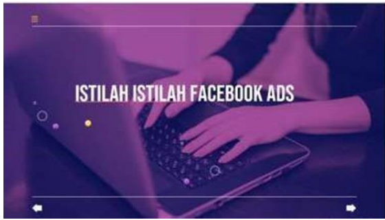
Gambar 3. Istilah Istilah facebook dan Instagram Ads