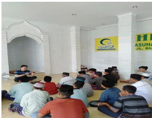
Gambar 5. Kegiatan hari pertama di panti asuhan yang sedang memaparkan materi pengenalan facebook dan Instagram Ads