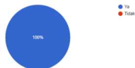
Gambar 9. Respon Responden Terkait Materi yang Disampaikan Apakah Menambah Pengetahuan serta Pemahaman

Apakah materi yang diberikan menambah pengetahuan serta pemahaman Anda mengenai strategi pemasaran di era digital? 6 responses