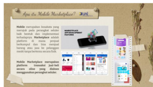
Gambar 6. Materi Mengenai Mobile Marketplace