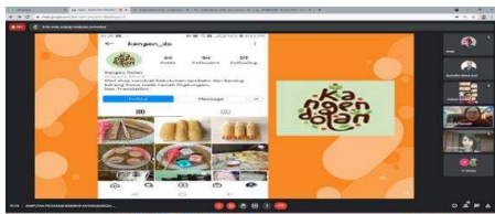
Gambar 2. Pemberian pengetahuan dan pelatihan pemasaran

Berikut adalah dokumentasi kegiatan-kegiatan tersebut