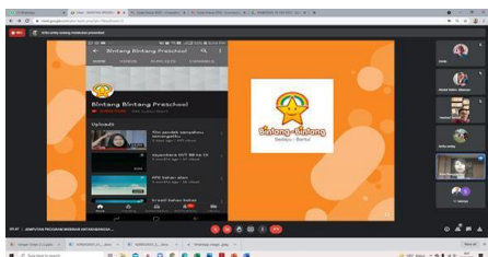
Gambar 3. Pemberian pengetahuan dan ketrampilan tentang media online