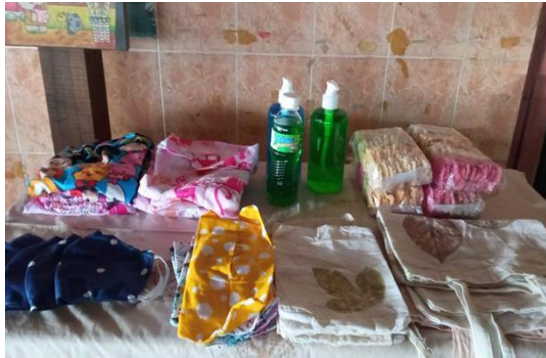
Gambar 1 Produk dari “Kangen Dolan”

kegiatan untuk mengisi waktu luang seperti pelatihan membuat dan memasak. Pendidik PAUD Bintang – Bintang menamakan kegiatan yang dilakukan tersebut dengan “Kangen Dolan”. Kegiatan tersebut sudah menghasilkan produk tapi belum dipasarkan untuk khalayak umum. Berikut ini adalah contoh dari produk “Kangen Dolan”