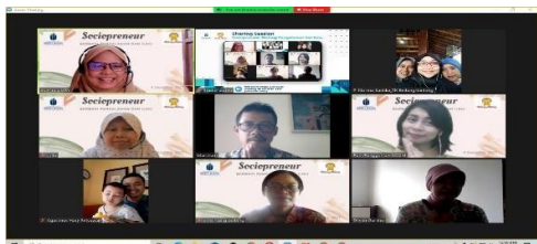
Gambar 4. Sharing session Sociopreneur

Keberhasilan dari kegiatan ini dapat dilihat dari Guru dapat menggali produk unggulan yang mengedepankan Kearifan Lokal, sekaligus mengembangkan konsep Sociopreneur dan kegiatan promosi baik dari sisionline promotion maupun kemampuan design e-leaflet dengan menerapkan Teknologi Informasi untuk memasarkan produk yang dihasilkan. Guru PAUD Bintang-Bintang telah mampu membuat IG Kangen Dolan untuk memasarkan produk secara media online, berikut adalah IG Kangen Dolan