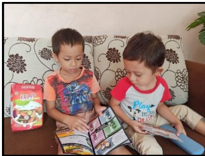
Gambar 3. Kegiatan membaca komik

Secara keseluruhan, anak yang bersedia membuat video story telling dalam kegiatan ini berusia 6 – 7 tahun (100%). Berdasarkan pengamatan terhadap video story telling yang telah dikumpulkan, secara keseluruhan anak sudah mampu menceritakan dengan baik dan benar isi dari komik “Pahlawan Gizi Seimbang”. Pengenalan yang sudah diberikan ini diharapkan mampu meningkatkan pengetahuan anak terkait gizi seimbang, dan kemudian dapat tercermin dari sikap mereka di kemudian hari dalam pemilihan makanan sehari-hari. Berikut beberapa dokumentasi kegiatan pengenalan konsep gizi seimbang pada anak dengan media komik “Pahlawan Gizi Seimbang”.