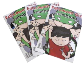
Gambar 1. Komik Pahlawan Gizi Seimbang

untuk edukasi gizi pada orangtua dan komik “Pahlawan Gizi Seimbang” untuk edukasi gizi pada anak. Berikut gambar komik “Pahlawan Gizi Seimbang”: