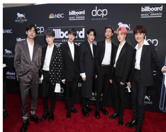
Gambar 1. Boyband Korea BTS

BTS atau dikenal sebagai Bangtan Boys merupakan grup Korea beranggotakan tujuh orang, membuat sejarah sebagai band K-pop pertama yang memiliki debut album di No. 1 di chart Billboard Top 200 A.S. dengan albumnya "Love Yourself: Tear," dimana dalam minggu pertama memiliki jumlah yang setara dengan 135.000 keping penjualan di Amerika Serikat (Chiu, 2018).