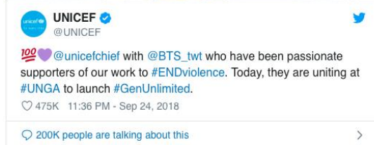
Gambar 3. Update Twitter UNICEF saat BTS menghadiri Sidang PBB 2018