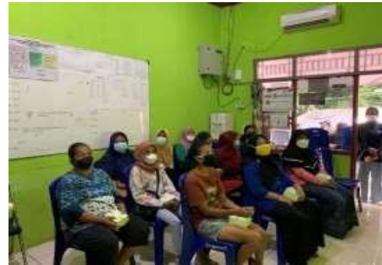
Gambar 6. Sesi Pelatihan Offline