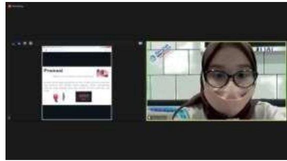
Gambar 5. Sesi Pelatihan Online

Materi yang diberikan sangat bermanfaat untuk para mitra UMKM. Dengan adanya materi ini, para mitra dapat dengan mudah mempraktekan cara membuat akun bisnis dan membuat iklan pada aplikasi Instagram. Memanfaatkan aplikasi instagram ini, para mitra UMKM dapat dengan mudah bertambahnya penjualan yang sangat berpengaruh pada omzet mereka. Adapun pada gambar 5 dan 6 diperlihatkan, sebagai berikut: