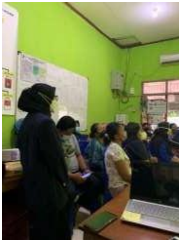
Gambar 1. Peserta Mitra

Adapun pemberian hadiah kepada mitra UMKM terkait tanya jawab materi yang sudah disampaikan oleh tim KKN diperlihatkan pada Gambar 2 sebagai berikut: