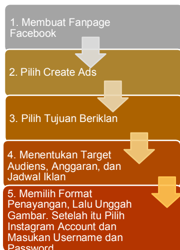
Gambar 4. Cara Membuat Iklan Instagram

Program pelatihan selanjutnya adalah bagaimana cara membuat iklan pada aplikasi instagram, diperlihatkan pada gambar 4 sebagai berikut: