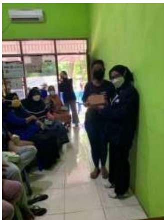
Gambar 2. Peserta Mitra

Adapun pemberian hadiah kepada mitra UMKM terkait tanya jawab materi yang sudah disampaikan oleh tim KKN diperlihatkan pada Gambar 2 sebagai berikut: