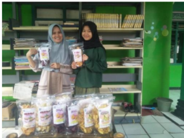
Gambar 10. Produk akhir UMKM

Sebelum dipasarkan produk keripik akan disimpan diruangan sejuk tanpa terkena matahari langsung. Untuk menghindari kerusakan, produk disimpan dalam keadaan tidak ditumpuk. Pada Gambar 10 diperlihatkan produk akhir keripik mitra UMKM.