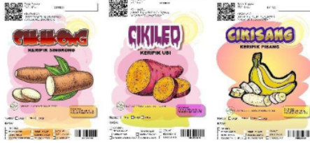
Gambar 9. Stiker kemasan Produk

Sebelum dipasarkan produk keripik akan disimpan diruangan sejuk tanpa terkena matahari langsung. Untuk menghindari kerusakan, produk disimpan dalam keadaan tidak ditumpuk. Pada Gambar 10 diperlihatkan produk akhir keripik mitra UMKM.