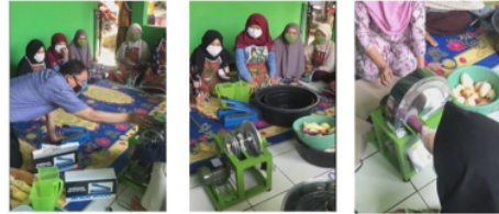
Gambar 7. Edukasi Penggunaan mesin tiris ( spinner ).

Mesin spinner (peniris) adalah mesin untuk menghilangkan residu minyak berlebih. Pada Gambar 7 diperlihatkan edukasi penggunaan mesin tiris ( spinner )