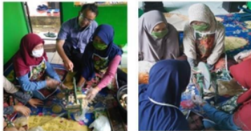
Gambar 5. Edukasi penanganan mesin rajang manual (perajang pisang).

Hasil akan optimal apabila perajangan bahan singkong dan ubi, mesin slicer diputar pada kecepatan 800-900 rpm ( rotate per menit ). Mesin rajang manual diputar secara manual menggunakan tuas putar. Mesin rajang manual cocok buat bahan kripiq yang lunak seperti pisang. Pada Gambar 5 diperlihatkan edukasi penanganan mesin rajang manual (perajang pisang).