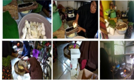
Gambar 2. Kegiatan pembuatan keripik di UMKM dilakukan secara konvensional.

Pada Gambar 2 diperlihatkan pembuatan keripik di UMKM di Desa Cikidang dilakukan secara konvensional.