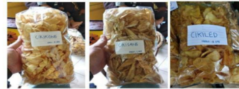
Gambar 3. Display produk keripik mitra UMKM Cikidang

Pada Gambar 3 diperlihatkan display produk keripik mitra UMKM Cikidang.