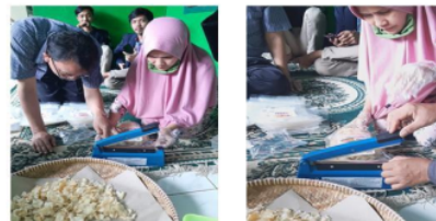
Gambar 8. Edukasi penggunaan mesin sealer plastik

Mesin sealer plastik pouch. Mesin sealer ini telah dimodifikasi agar suhunya bisa diatur. Tim pelaksana telah memberikan edukasi optimasi penggunaan mesin sealer terutama pada pengaturan lama waktu press mesin terhadap daya rekat plastik. Pada Gambar 8 diperlihatkan edukasi penggunaan mesin sealer plastik