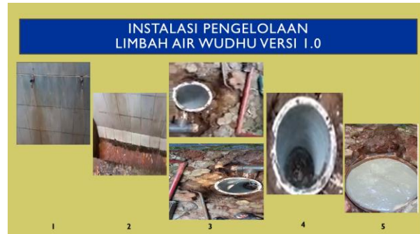
Gambar 14. Instalasi resapan limbah air wudhu

Keberhasilan sosialisasi tentang pentingnya upaya konservasi air dilanjutkan dengan pemasangan instalasi resapan limbah air wudhu. Instalasi ini merupakan perangkat yang diletakkan di bawah permukaan tanah dengan kedalaman 90 meter. Perangkat dapat berupa satu atau buis beton yang diletakkan berdekatan dan terhubung. Pada setiap sisi yang melingkupi buis beton dibuat lubang dengan diameter 4 cm dan berjarak 10 cm antar lubang untuk memudahkan air meresap ke dalam tanah. Instalasi tersebut dihubungkan dengan saluran limpasan air wudhu yang telah digunakan oleh jamaah. Pemilihan pengembalian limbah air wudhu berdasarkan pertimbangan karena air tersebut tidak tercemar oleh polutan khususnya detergent. Dengan demikian limbah air wudhu tidak merusak struktur dan fungsi tanah. Berikut ini adalah instalasi resapan limbah air wudhu yang akan diusulkan HKI (gambar 14).