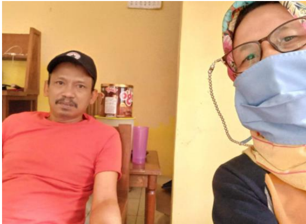
Gambar 12. Sosialisasi kepada tokoh masyarakat