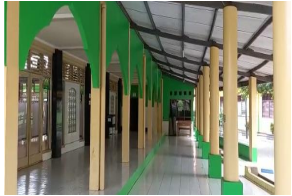
Gambar 10. Masjid Al Ma'mur

Kegiatan pengabdian kepada masyarakat berupa sosialisasi menunjukkan peningkatan pengetahuan tentang siklus hidrologi /air, dinamika persediaan air di bawah tanah, sistem peresapan air hujan dan pentingnya upaya konservasi air bersih. Pada awalnya masyarakat yang memahami sekitar 50% namun setelah diberikan penjelasan seluruhnya menjadi paham. Akan tetapi ketika disampaikan upaya konservasi dengan pemasangan instalasi resapan limbah air wudhu masyarakat menolak. Tersebut. Masyarakat khawatir terjadi pembongkaran areal masjid akibat pemasangan instalasi. Persetujuan dari masyarakat membutuhkan waktu karena perlu dirapatkan dan dipahami oleh jama'ah masjid. Menghadapi hal ini para pengurus DKM masjid membantu mencari alternatif tempat yang tidak banyak menimbulkan pembongkaran. Selain itu juga pihak DKM turut memberikan pemahaman kepada masyarakat pentingnya melakukan konservasi air untuk kebutuhan beribadah. Berikut ini adalah dokumentasi ketika sosialisasi secara individual dari rumah ke rumah (Gambar 11,12,13)