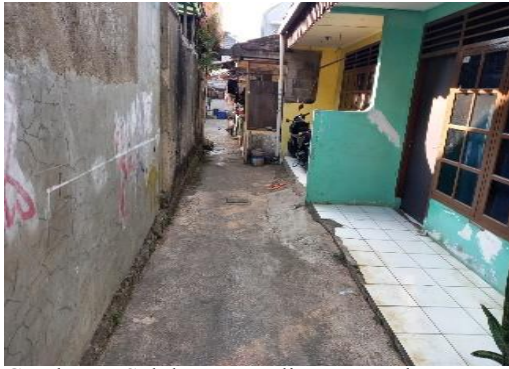
Gambar 5. Selokan yang ditutup untuk dimanfaatkan

Limbah domestik sebagian dibuang masyarakat ke dalam selokan sehingga alirannya tersendat dan menimbulkan genangan dalam kondisi anaerob (Gambar 5 dan 6). Sistem pengelolaan sampah melalui pemilahan sampah organik dan anorganik belum dilakukan, sehingga sampah langsung diangkut dengan gerobak dan dibuang ke tempat pembuangan sampah.