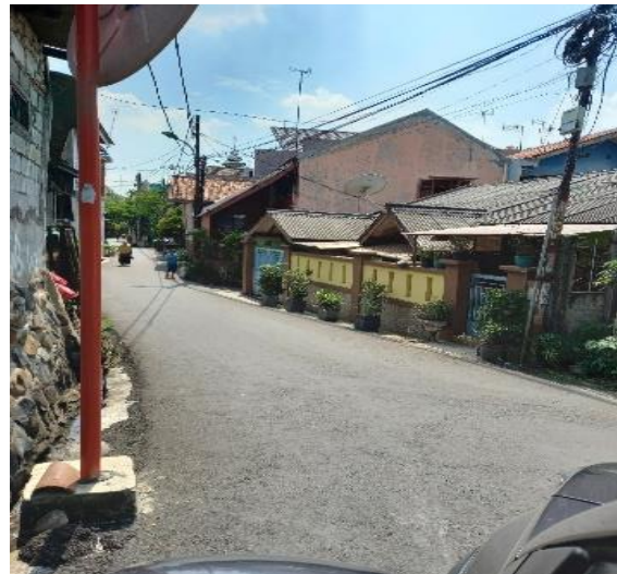
Gambar 3. Lingkungan pemukiman yang minim areal resapan

selokan bertujuan untuk memperluas ruang untuk beraktifitas seperti menjemur pakaian, berjualan serta parkir kendaraan bermotor. Kebersihan selokan masih diabaikan oleh masyarakat walaupun sebagian masyarakat menggunakannya sebagai tempat bersosialisasi antar warga karena berhadapan langsung dengan teras rumah. Kurangnya perhatian terhadap lingkungan pemukiman dapat disebabkan karena sosial masyarakat didominasi penduduk urban yang umumnya tinggal di rumah sewa.