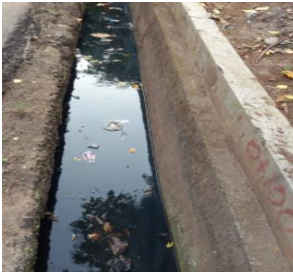
Gambar 6. Selokan yang tidak lancar dan dijadikan tempat pembuangan sampah oleh sebagian masyarakat

Limbah domestik sebagian dibuang masyarakat ke dalam selokan sehingga alirannya tersendat dan menimbulkan genangan dalam kondisi anaerob (Gambar 5 dan 6). Sistem pengelolaan sampah melalui pemilahan sampah organik dan anorganik belum dilakukan, sehingga sampah langsung diangkut dengan gerobak dan dibuang ke tempat pembuangan sampah.