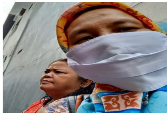
Gambar 11. Sosialisasi secara individual dengan masyarakat

Kegiatan pengabdian kepada masyarakat berupa sosialisasi menunjukkan peningkatan pengetahuan tentang siklus hidrologi /air, dinamika persediaan air di bawah tanah, sistem peresapan air hujan dan pentingnya upaya konservasi air bersih. Pada awalnya masyarakat yang memahami sekitar 50% namun setelah diberikan penjelasan seluruhnya menjadi paham. Akan tetapi ketika disampaikan upaya konservasi dengan pemasangan instalasi resapan limbah air wudhu masyarakat menolak. Tersebut. Masyarakat khawatir terjadi pembongkaran areal masjid akibat pemasangan instalasi. Persetujuan dari masyarakat membutuhkan waktu karena perlu dirapatkan dan dipahami oleh jama'ah masjid. Menghadapi hal ini para pengurus DKM masjid membantu mencari alternatif tempat yang tidak banyak menimbulkan pembongkaran. Selain itu juga pihak DKM turut memberikan pemahaman kepada masyarakat pentingnya melakukan konservasi air untuk kebutuhan beribadah. Berikut ini adalah dokumentasi ketika sosialisasi secara individual dari rumah ke rumah (Gambar 11,12,13)