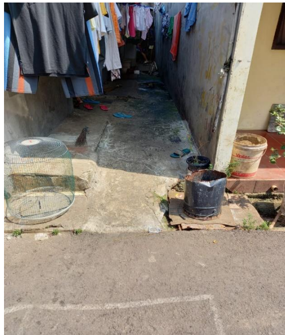
Gambar 4. Kondisi lingkungan yang rapat