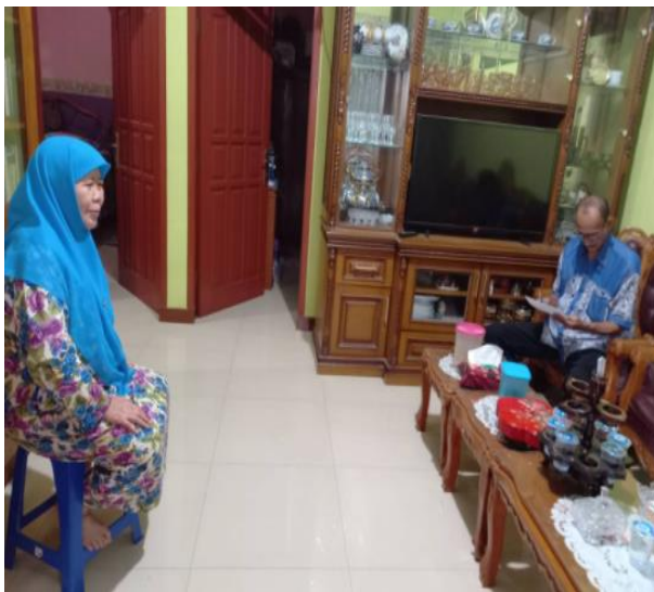
Gambar 13. Diskusi dengan ketua LKM

Keberhasilan sosialisasi tentang pentingnya upaya konservasi air dilanjutkan dengan pemasangan instalasi resapan limbah air wudhu. Instalasi ini merupakan perangkat yang diletakkan di bawah permukaan tanah dengan kedalaman 90 meter. Perangkat dapat berupa satu atau buis beton yang diletakkan berdekatan dan terhubung. Pada setiap sisi yang melingkupi buis beton dibuat lubang dengan diameter 4 cm dan berjarak 10 cm antar lubang untuk memudahkan air meresap ke dalam tanah. Instalasi tersebut dihubungkan dengan saluran limpasan air wudhu yang telah digunakan oleh jamaah. Pemilihan pengembalian limbah air wudhu berdasarkan pertimbangan karena air tersebut tidak tercemar oleh polutan khususnya detergent. Dengan demikian limbah air wudhu tidak merusak struktur dan fungsi tanah. Berikut ini adalah instalasi resapan limbah air wudhu yang akan diusulkan HKI (gambar 14).