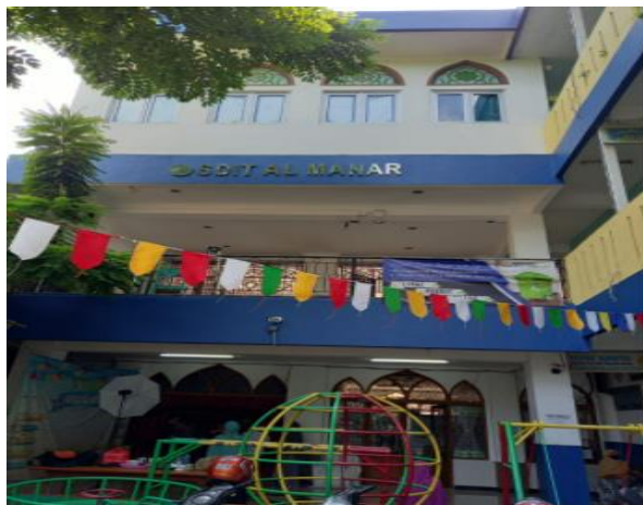
Gambar 8. Masjid Al Manar dan sekolah