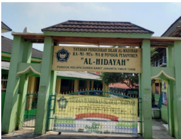
Gambar 9. Madrasah dan pesantren Al Hidayah