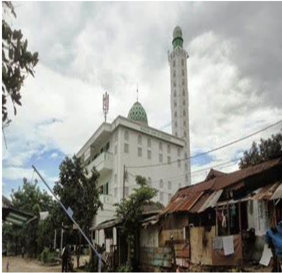
Gambar 7. Masjid Al Hidayah