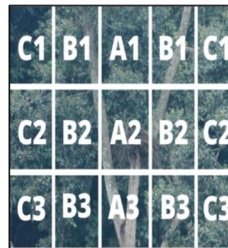
Gambar 5. Pembagian ruang tajuk pohon.

sayap, dan memonitoring keberadaan mangsa dan individu lain di sekitar pohon sarang. Cabang yang dekat dengan batang utama memiliki ukuran \pm 90^\circ , ternaungi oleh tajuk, dan cabang tidak rapat oleh dedaunan dan cabang kuat untuk menopang tubuh Elang Jawa. Sitorus & Hernowo (2016) menyatakan bahwa Elang Jawa bertengger pada bagian tengah pohon karena menyediakan cabang yang kuat untuk menopang tubuh Elang Jawa (Gambar 4).