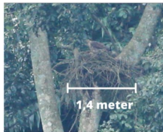
Gambar 4. Ukuran Sarang Elang Jawa.

Sarang Elang Jawa sendiri terdiri dari ranting-ranting pohon, kemudian dilapisi dengan daun-daun basah sebagai alasnya. Sarang Elang Jawa yang berada di pohon Huru ini memiliki diameter \pm 1,4 m, jari-jari 70 cm dan kedalaman sarang \pm 3 m dengan memiliki bentuk kerucut terbalik (Gambar 3). Tingkat kesesuaian habitat bagi suatu spesies akan berbeda antara satu spesies dengan spesies yang lainnya, hal ini dikarenakan setiap spesies memiliki karakteristik komponen habitat yang berbeda-beda untuk mempertahankan hidupnya (Prasetyo 2002).