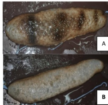
Gambar 5. Holothuria fuscocinerea dari perairan sekitar P. Pramuka (A. Dorsal; B. Ventral)

Jenis teripang lain yang dijumpai di sekitar P. Prmauka adalah Holothuria fuscocinerea . Teripang ini secara morfologi memiliki penampang tubuh bulat, sisi ventral yang cenderung datar, dan lubang anus yang bulat. Warna tubuh bagian dorsal coklat dan bercorak, sedangkan bagian ventral berwarna coklat pucat tanpa corak. Tipe spikula yang ditemukan di bagian dorsal adalah tipe meja dan kancing. Teripang ini memiliki habitat di daerah lamun sehingga banyak dijumpai di kawasan tersebut (Gambar 5).