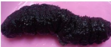
Gambar 3. H. atra dari perairan sekitar P. Pari

Jenis teripang lain yang juga di temukan di perairan sekitar P. Pari adalah Holothuria atra . Secara morfologi, teripang ini memiliki penampang tubuh bulat, sisi ventral yang cenderung datar, dan lubang anus yang bulat. Warna tubuh hitam kulit tubuhnya lembut dan tebal. Tipe spikula yang ditemukan di bagian dorsal adalah tipe meja, roset, dan lempeng. Ditemukan di daerah bersubstrat pasir kasar dan tubuhnya diselimuti oleh pasir halus (Gambar 3).