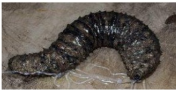
Gambar 2. H. impatiens dari perairan sekitar P. Pari

Jenis Holothuria impatiens memiliki penampang tubuh bulat, sisi ventral cenderung datar, dan lubang anus bulat. Warna tubuh adalah abu-abu dengan belang berwarna hitam di punggungnya. Tubuhnya lunak dan tipis. Tipe spikula yang ditemukan di bagian dorsal adalah tipe meja dan kancing. Teripang ini ditemukan di sela pipa besar yang permukaannya seperti batu (Gambar 2).