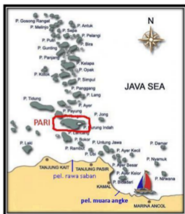
Gambar 1. Lokasi pengambilan teripang di sekitar perairan P. Pari dan P. Pramuka[11]

Identifikasi morfologi dan anatomi dilakukan di Laboratorium Biologi Makro, Departemen Manajemen Sumberdaya Perairan, Fakultas Kelautan dan Ilmu Perikanan, IPB tempat identifikasi dan analisa morfologi anatom